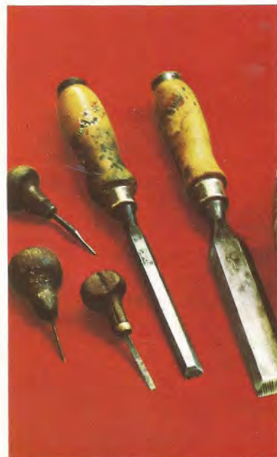
Buril, cincel y lima. Herramientas del tallador.