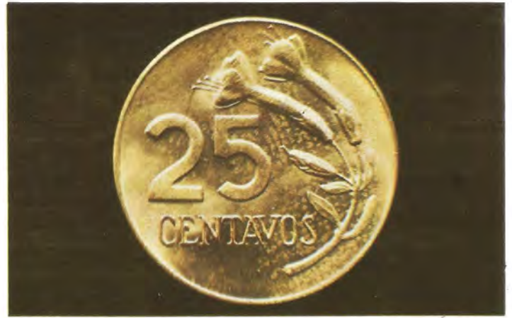
"FLOR DE LA CANTUTA". — Circularon de veinticinco, diez y cinco centavos, en latón. Datan de 1965. El requiebro de la imagen se muestra como significado de la nobleza incaica. Mide 28 mm. de diámetro.