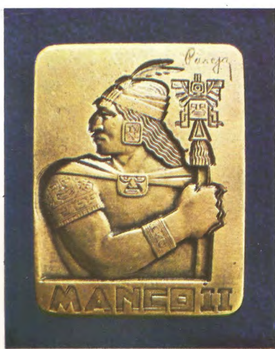
"MANCO II".— Burilada en bronce mediante talla directa, para el IV Centenario de la Fundación del Cusco, en 1934.