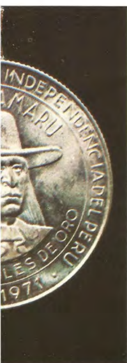
"INDEPENDENCIA DEL PERU".— Emitida en 1971, en plata, con motivo del centenario de la independencia del Perú. Tiene un diámetro de 37 mm.