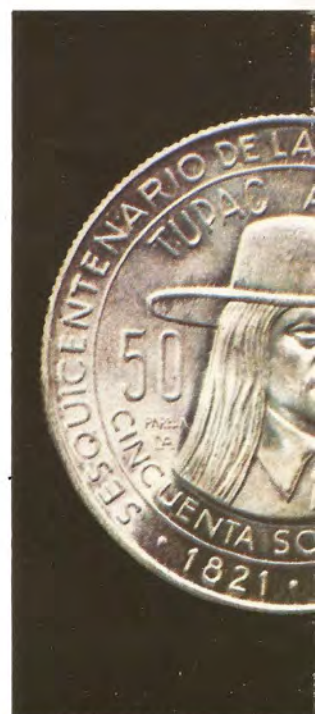
"TUPAC AMARU". — Creada con motivo del sesquicentenario de la independencia del Perú. Su diámetro es de 25 mm.