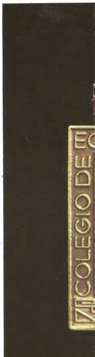
"COLEGIO DE ECONOMIA". — Se creó para realizar el 1er. Congreso de Economía del Perú.