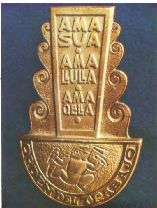
"ORDEN DEL TRABAJO". — Está simbolizada por el tumi y es la más alta condecoración que, desde su creación en 1964, otorga el Ministerio de Trabajo.