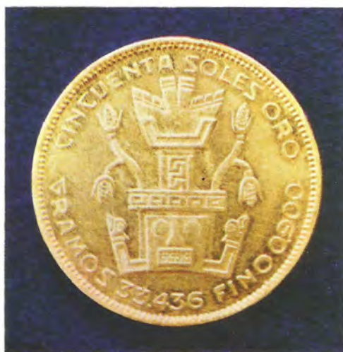
"EL INCA".— Primera moneda creada por Pareja, hecha en oro en 1930. Tiene un diámetro de 34 mm. y un valor nominal de cincuenta soles.