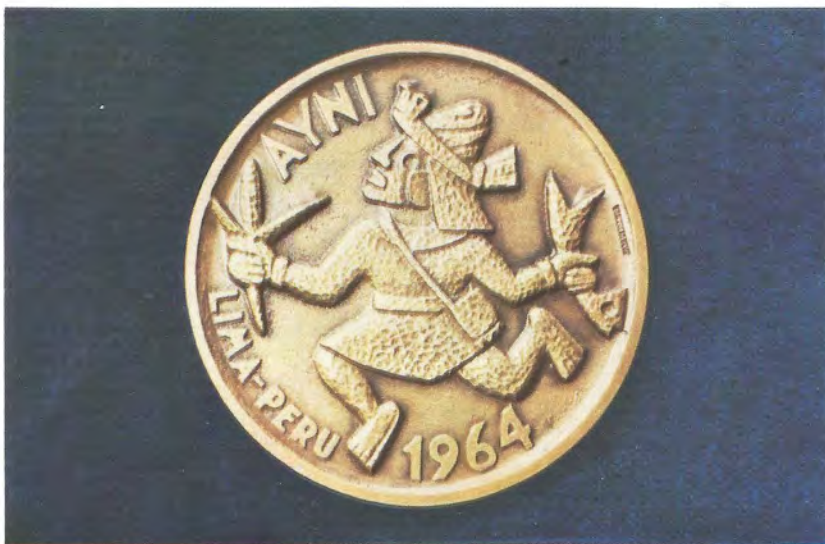
"EL AYNI".— Realizada para la Organización de Estados Americanos en 1964. Es en bronce y fue hecha mediante talla directa.