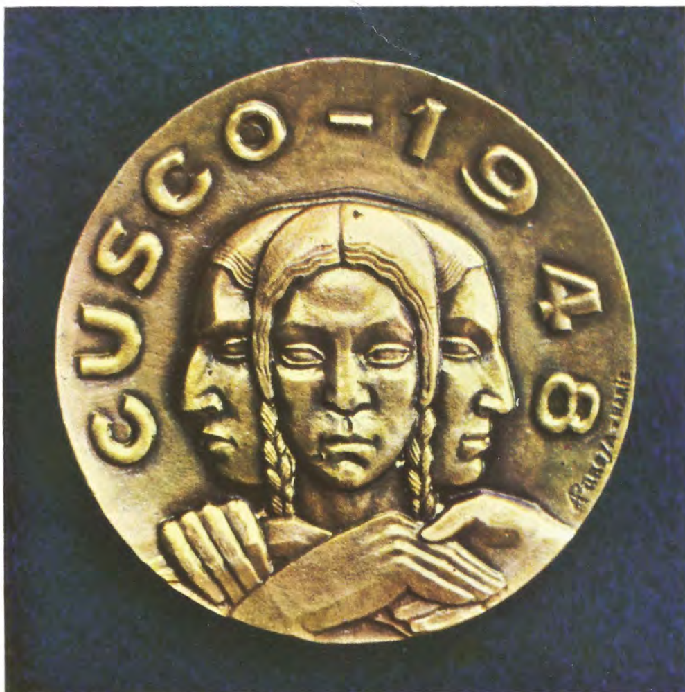
"CUSCO 1948".— Realizada en Francia, se talló a mano para el II Congreso Indigenista Interamericano de Cusco.

Desde entonces ya se vislumbraban sus condiciones para llegar a ser un destacado grabador medallista.