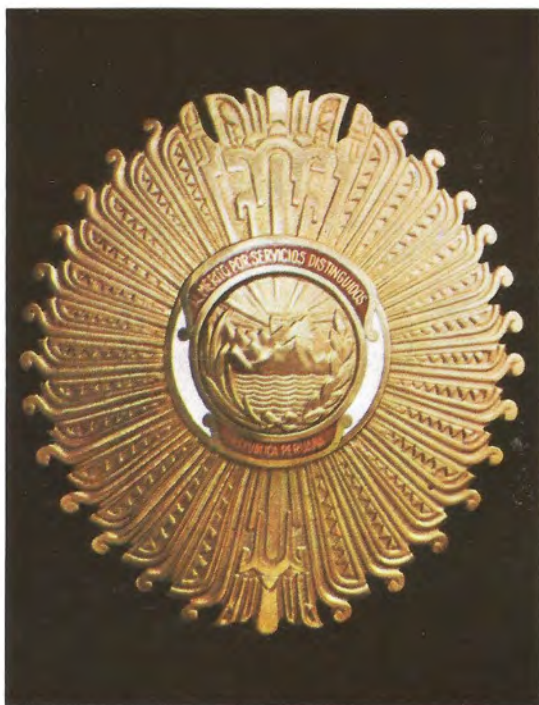
"ORDEN AL MERITO POR SERVICIOS DISTINGUIDOS". — Distintivo mayor del Ministerio de Relaciones Exteriores. Se constituyó en 1950.