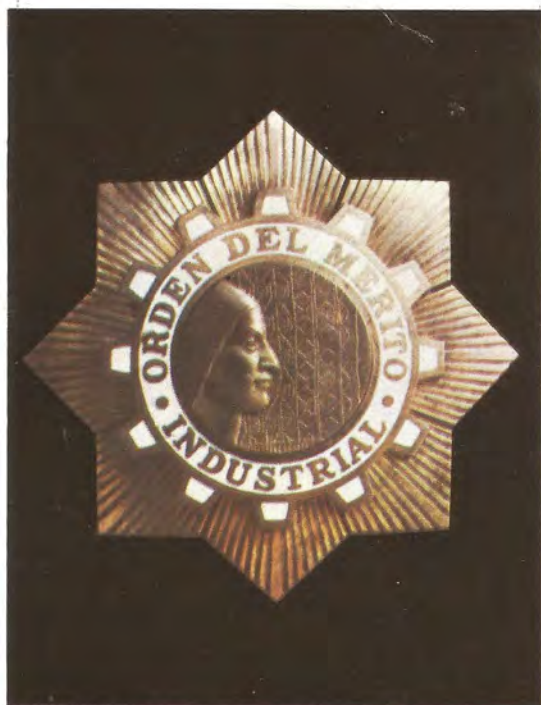
"ORDEN AL MERITO INDUSTRIAL". — Máximo galardón del Sector Industria. Se emitió en 1964.