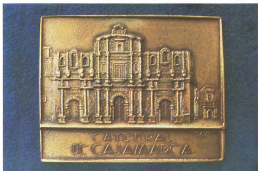
"CATEDRAL DE CAJAMARCA".— Creada con motivo del Congreso de Arquitectos del Perú en 1974. Fue burilada en bronce, mediante talla directa.