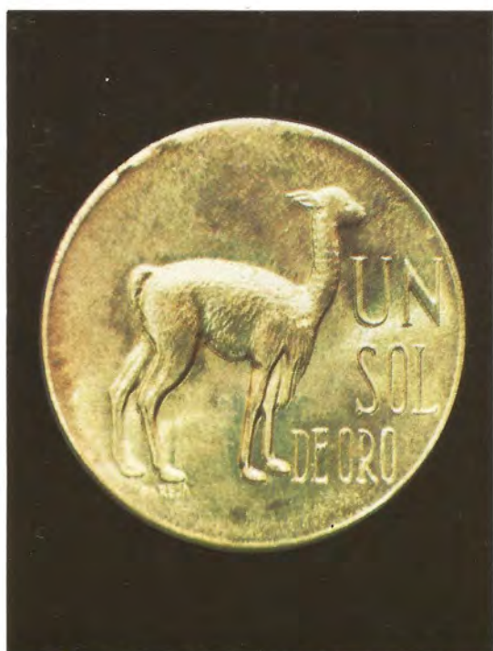
"LA VICUÑA". — Moneda circulante por valor de un sol, con un diámetro de 28 mm. Fue creada en 1967 en latón. Con la misma imagen, existe también la de medio sol.