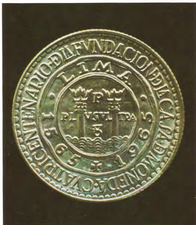
"IV CENTENARIO DE LA CASA DE MONEDA DE LIMA". — Recuerda su fundación institucional y su desarrollo en cuatro siglos, 1565-1965; fundida en oro, con un diámetro de 37 mm. Su valor nominal fue de cien soles.

Para él el arte tuvo un sentido moral. Amó la paz y cuestionó la injusticia social. Fue parte de una generación que ha partido cuando aún está pendiente la realización del nuevo Perú que soñó.