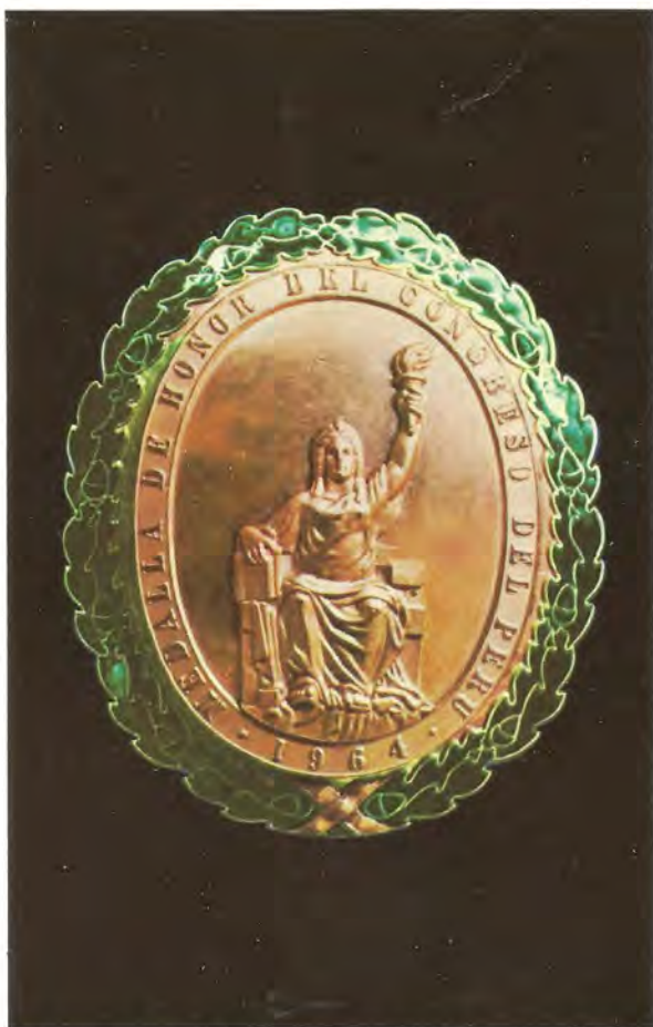
"MEDALLA DE HONOR DEL CONGRESO DEL PERU". — Condecoración que confiere el Congreso de la República a personalidades ilustres, del país y del extranjero, en representación del fiel cumplimiento de las leyes. Fue creada en 1964.