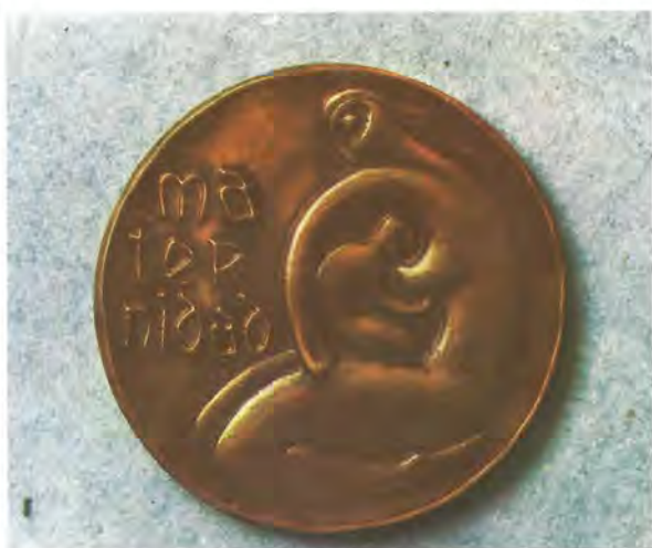
"MATERNIDAD". — Medalla tallada en bronce, en 1962, en homenaje a la madre peruana.

Piqueras Cotolí pretendió influir en la formación creativa del discípulo con la reciedumbre del estilo barroco español y la forma indigenista peruana. Este propósito lo alcanza posteriormente Pareja en muchas de sus obras, como en la medalla "El Mestizaje", en la que dos razas se encuentran presentes y unidas: el español le entrega la cruz al inca y éste la mazorca de maíz a aquél.