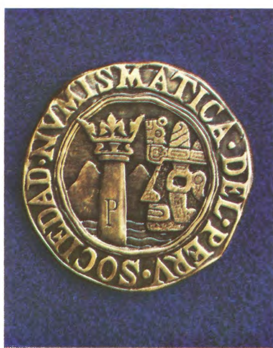
"SOCIEDAD NUMISMATICA DEL PERU".— Emitida en 1951, con el fin de celebrar el XX Aniversario de su fundación. Está labrada directamente a mano sobre bronce.