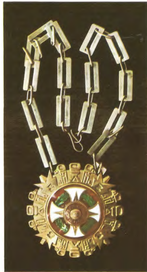
"PALMAS MAGISTERIALES". — Suprema investidura que brinda el Ministerio de Educación. Fue instituida en 1949.

"P areja dejó, a través de muchos años de labor en esa Casa, huellas de su excepcional habilidad, en innumerables monedas y medallas. Al desaparecer Armando Pareja, ¿queda escuela y continuadores de su estilo? Si así no fuera, habría que fundar la primera, e infundir en sus seguidores el terco y acendrado amor por el Perú que asoma en todas sus obras"